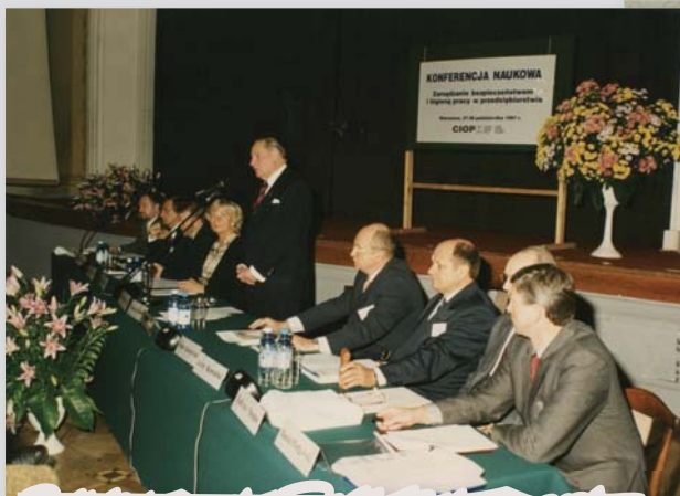
Konferencja naukowa „Zarządzanie bezpieczeństwem i higieną pracy w przedsiębiorstwie”. 28.10.1997 r.