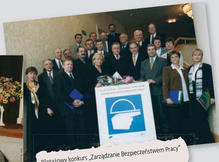
Pilotażowy konkurs „Zarządzanie Bezpieczeństwem Pracy” 1999-2000